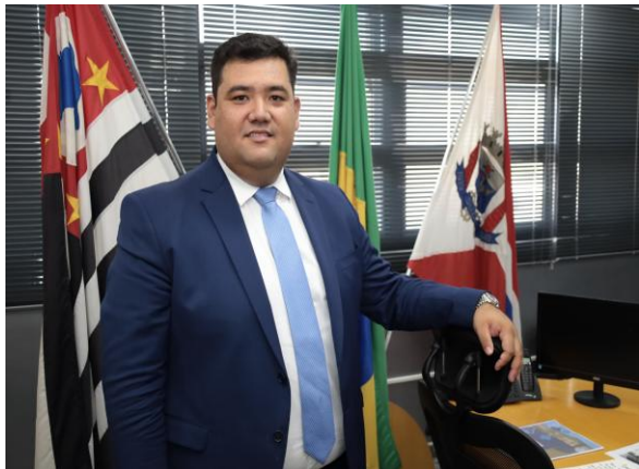
Pedro Charles Shirakawa Ishi Prefeito Municipal