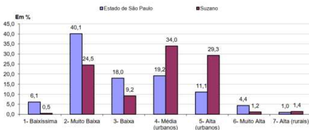
Distribuição da População, segundo Grupos do Índice Paulista de Vulnerabilidade Social – IPVS Estado de São Paulo e Município de Suzano – 2010

Em Suzano, a maior parte da população (34%) encontra-se no Grupo 4, que representa vulnerabilidade média em setores urbanos. Neste grupo, a renda domiciliar nominal média é de R$1.596, e 26,7% dos domicílios têm renda per capita de até meio salário mínimo. A idade média dos responsáveis pelos domicílios é de 46 anos, e 12,4% deles têm menos de 30 anos. Além